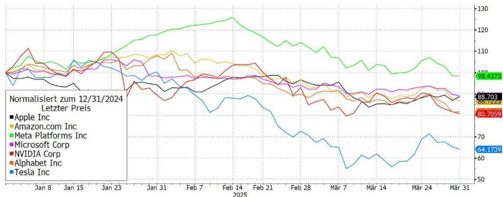
Abbildung 2, Aktienkurs seit Jahresanfang 2025, Quelle: Bloomberg

Die beschriebenen Herausforderungen forderten ihren Tribut an den Aktienmärkten. Hinzu kam der Auftakt von DeepSeek, einer neuen KI-Variante aus China die den US-amerikanischen Technologie-Unternehmen die globale Führerschaft streitig macht.