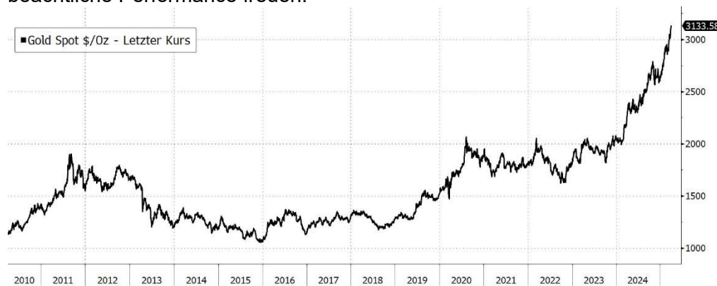
Abbildung 3, Goldkurs in USD/Unze seit 2010, Quelle: Bloomberg

Der Goldpreis hat Mitte März 2025 zum ersten Mal die Marke von 3.000 USD überwunden. Die Feinunze war mit gut 2.600 USD ins neue Jahr gestartet – insofern konnten sich alle Gold-Bullen schon im jungen Jahr 2025 über eine beachtliche Performance freuen.