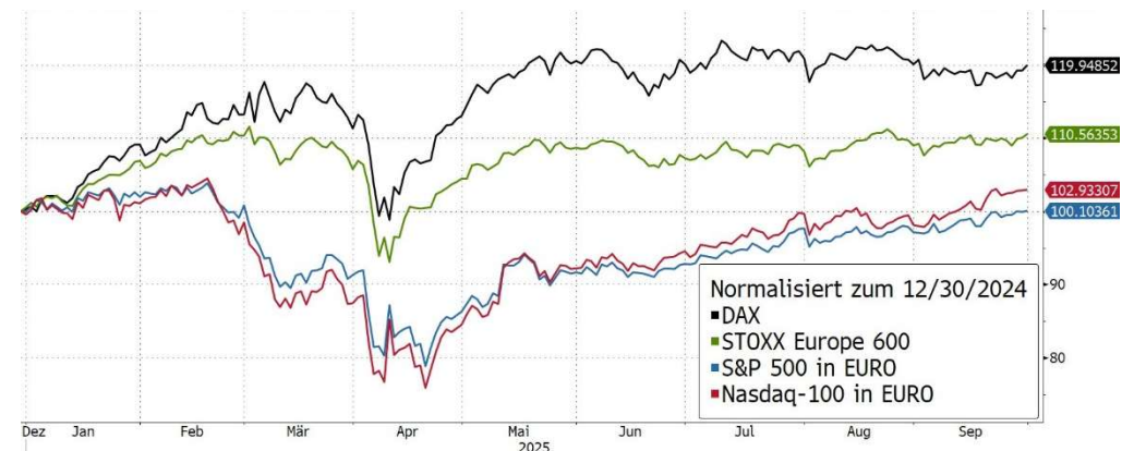
Abbildung 2, Wertentwicklung Aktienindices in Euro, Quelle: Bloomberg

Der US-Dollar verlor seit Jahresbeginn rund 13,3 % gegenüber dem Euro, was für Anleger aus Deutschland gravierende Folgen hatte. Während der S&P 500 in USD gerechnet um rund 13,7 % zulegte, blieben für Euro-Investoren davon kaum 0,4 % übrig. Die Gründe liegen weniger in fundamentalen Faktoren wie Zinsdifferenzen, sondern in politischem Vertrauensverlust in den Greenback.