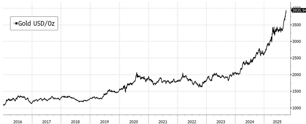
Abbildung 3, Goldpreis je Unze in USD, Quelle: Bloomberg

Gold war einer der großen Gewinner des dritten Quartals 2025. Mit einer Jahresperformance von über 47 % in USD gerechnet erreichte das Edelmetall neue Höchststände. Gründe hierfür sind unter anderem: